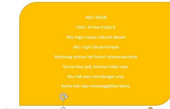
Gambar 2: Contoh teks puisi 2

Teks puisi pertama ini menunjukkan kecemasan akan pandemic Covid-19 yang melanda dunia. Penulis ingin Corona menghilang dari muka bumi untuk bertemu dan berkumpul bersama teman-teman dan keluarganya tanpa ada batasan. Dia bisa menikmati pemandangan kota yang ramai. Banyak orang yang berjualan, membeli makanan, bahkan sekedar berfoto bersama orang tersayang. Penulis berharap Corona segera pergi.