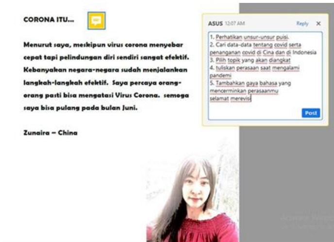
Gambar 5: umpan balik tentang kegiatan menulis

Tahap revisi merupakan tahap pemberian umpan balik dan evaluasi dari dosen untuk meningkatkan kemampuan menulis mahasiswa BIPA. Menulis puisi dalam bahasa asing tentu bukan kegiatan yang mudah. Oleh karena itu, dosen harus memberikan masukan dan arahan kepada mahasiswa untuk merevisi sesuai dengan struktur puisi yang tepat.